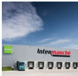
Poznan II Logistics Centre

Od rozpoczęcia działalności w Polsce w 2005 roku, portfolio nieruchomości firmy Goodman nieustannie rośnie, a Grupa jest obecnie postrzegana jako jeden z wiodących deweloperów na rynku. Goodman buduje i zarządza wysokiej jakości nieruchomościami magazynowymi i logistycznymi, których jest jednocześnie właścicielem. Nieruchomości powstają w kluczowych lokalizacjach w Polsce, takich jak Wrocław, Poznań, Kraków, Gdańsk, Gliwice, Łódź, Toruń, Konin, Sosnowiec czy Warszawa. Na koniec grudnia 2016 roku Goodman zarządzał w Polsce portfelem obiektów przemysłowych o powierzchni ponad 760 000 m 2 .