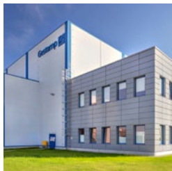
Wrocław IV Logistics Centre