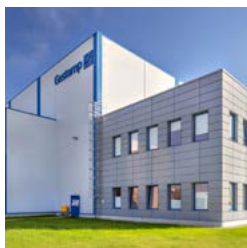
Wrocław IV Logistics Centre