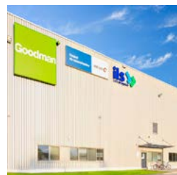
Sosnowiec Logistics Centre