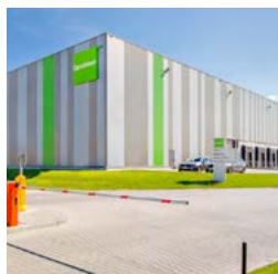
Gliwice Logistics Centre

Od rozpoczęcia działalności w Polsce w 2005 roku, portfolio nieruchomości firmy Goodman nieustannie rośnie, a Grupa jest obecnie postrzegana jako jeden z wiodących deweloperów na rynku. Goodman buduje i zarządza wysokiej jakości nieruchomościami magazynowymi i logistycznymi, których jest jednocześnie właścicielem. Nieruchomości powstają w kluczowych lokalizacjach w Polsce, takich jak Wrocław, Poznań, Kraków, Gdańsk, Gliwice, Łódź, Toruń, Konin, Sosnowiec czy Warszawa. Na koniec grudnia 2017 roku Goodman zarządzał w Polsce portfelem obiektów przemysłowych o powierzchni ponad 958 000 m 2 .